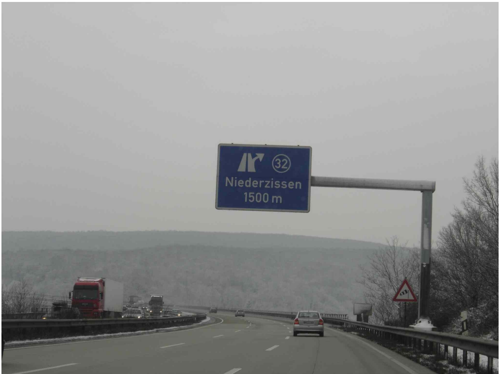
AS Niederzissen und die 43 m hohe Vinxtbachtalbrücke