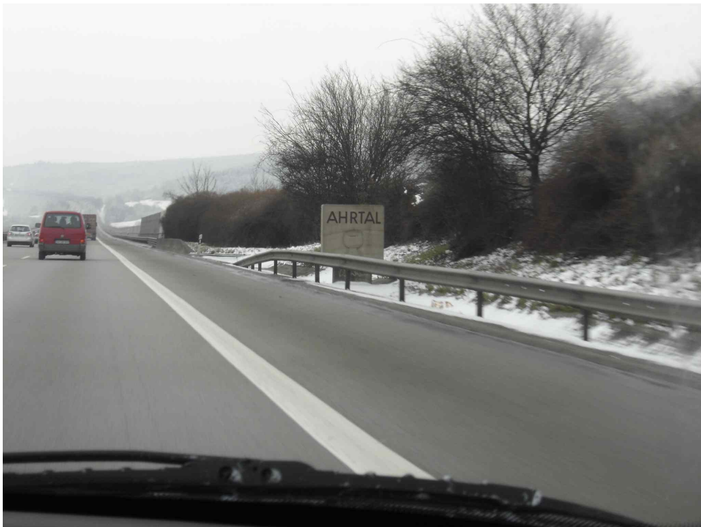
Die 50 m hohe Ahrthalbrücke.