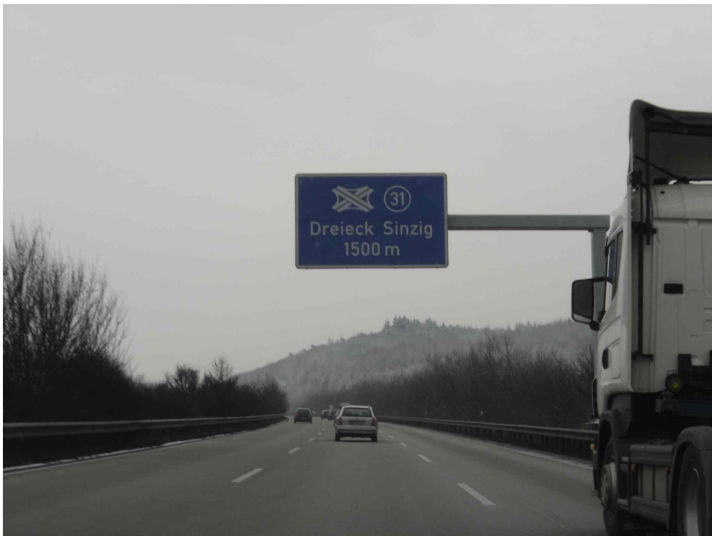
Das AD Sinzig – A 571 – kündigt sich an.